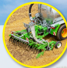
Kompatibel mit allen Ausbringgeräten